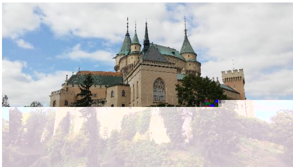
Château de Bojnice

La Slovaquie est très bien située, vous pouvez donc en profiter pour faire des excursions pendant le semestre ! De plus ce n'est pas très cher grâce au train que vous avez gratuitement dans toute la Slovaquie avec votre ISIC. De Banska, il est facile de se rendre à Bratislava par le train (3h30) mais aussi à Budapest et à Vienne. Nous sommes également allés à Cracovie en louant des voitures et à Prague par le bus. Nous avons aussi découvert la Slovaquie, pas loin de Banska il y a une ville classée au patrimoine mondial de l'UNESCO (Banska Stiavnica) ainsi qu'une église en bois à Hronsek. N'hésitez pas également à vous rendre au château de Bojnice qui est magnifique et à Trencin, petite ville avec un château. Passez à l'office du tourisme à Banska ! ;)