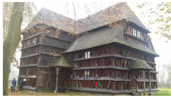
Eglise de Hronsek