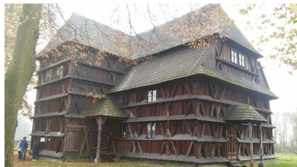
Eglise de Hronsek