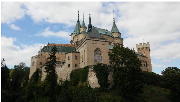
Château de Bojnice

La Slovaquie est très bien située, vous pouvez donc en profiter pour faire des excursions pendant le semestre ! De plus ce n'est pas très cher grâce au train que vous avez gratuitement dans toute la Slovaquie avec votre ISIC. De Banska, il est facile de se rendre à Bratislava par le train (3h30) mais aussi à Budapest et à Vienne. Nous sommes également allés à Cracovie en louant des voitures et à Prague par le bus. Nous avons aussi découvert la Slovaquie, pas loin de Banska il y a une ville classée au patrimoine mondial de l'UNESCO (Banska Stiavnica) ainsi qu'une église en bois à Hronsek. N'hésitez pas également à vous rendre au château de Bojnice qui est magnifique et à Trencin, petite ville avec un château. Passez à l'office du tourisme à Banska ! ;)