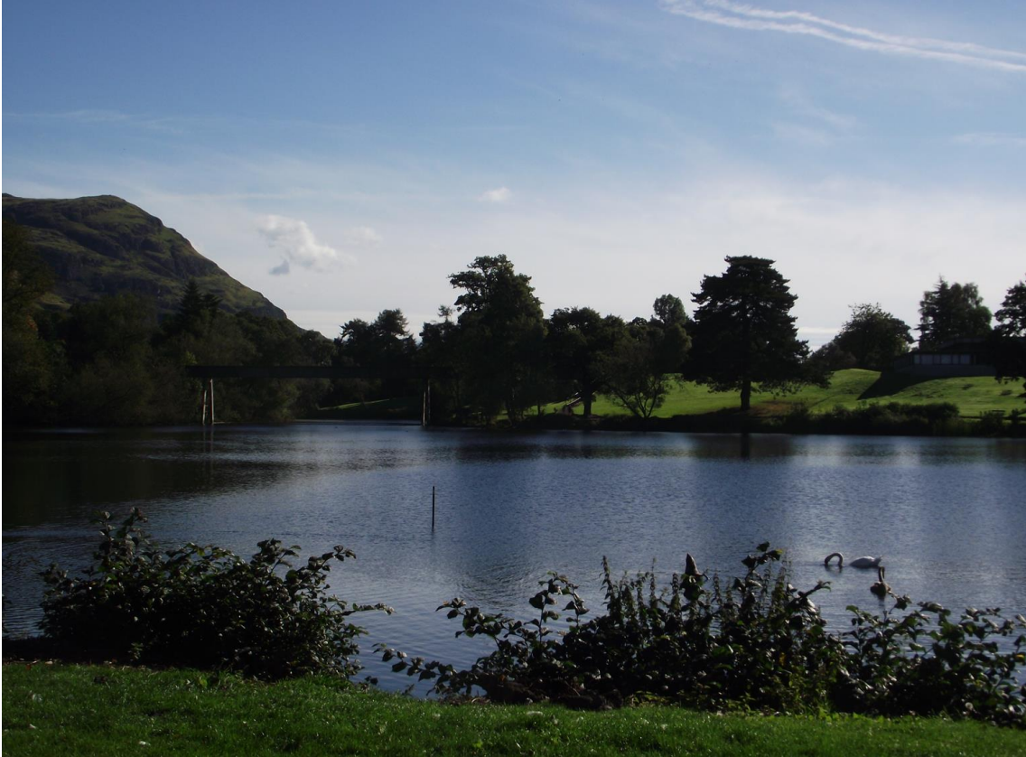
Airthrey Loch, situé au centre du campus